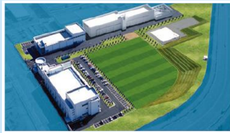
R&D Center Ochang, Korea