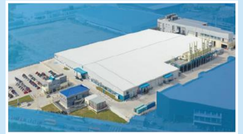
Factory Penang, Malaysia