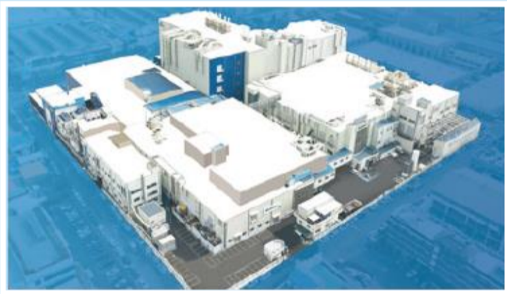
Factory Cheongju, Korea