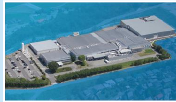
Factory Chino, Japan